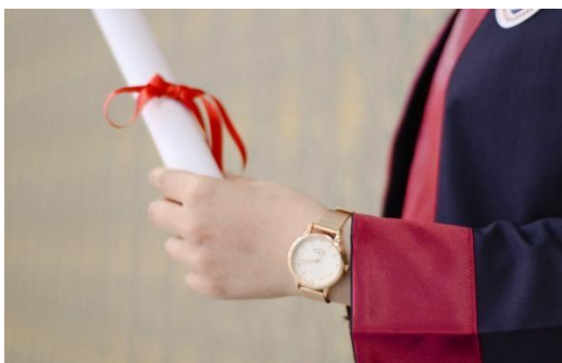
Rysunek 1.2. Dyplom ukończenia studiów